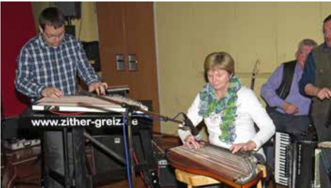
Musikantenstammtisch in Reudnitz – Im Saal der Reudnitzer Turnhalle „Concordia“ trafen sich über 100 Gäste und Musikanten zum Musizieren. Von Flötenspiel über Tuba, Geige, Zither, Akkordeon und weiteren Instrumenten bis zum Gesang des Mohlsdorfer Männerchors war alles vertreten. Auch der gemeinsame Gesang von Volksliedern begeisterte alle. Für eine gute Bewirtung sorgte das Team der Gaststätte. Ein wieder einmal gelungener Musikantenstammtisch, der im November seine Fortsetzung finden soll.

Der Auftritt des Mohlsdorfer Chores, der mit einem Liederstrauß gratulierte, war für sie eine der großen Überraschungen.