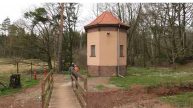
Im Wasserwerk Neudeck haben über 250 Neugierige die Gelegenheit genutzt, um sich einmal genau den Weg des Wassers von dem Brunnen bis zum Verbraucher anzusehen. Aus dem 1929 gebauten 40 Meter tiefen Brunnen werden täglich 840.000 Liter Trinkwasser in das Leitungsnetz von Mohlsdorf, Reudnitz, Gottesgrün und in den Hochbehälter Herrenreuth gepumpt.