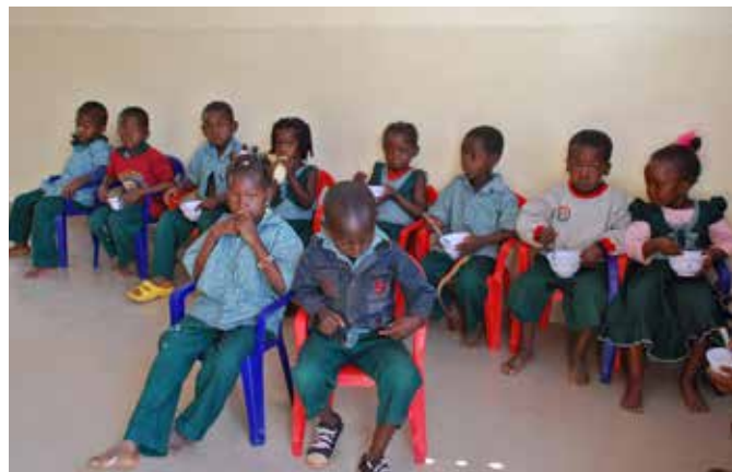
Projekt Waisenkinder: In der Tagesbetreuung erhalten diese Waisenkinder u.a. ein warmes Essen.