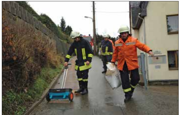
Feuerwehreinsatz zur Beseitigung einer Ölspur. Am 14.12. rückten die Kameraden der Mohlsdorfer Feuerwehr aus, um auf dem Haardtberg eine Ölspur zu beseitigen.