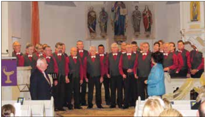
Der Männerchor Mohlsdorf stimmt in der Kirche Herrmannsgrün zu Mohlsdorf auf die Festtage ein. Ein großes Klangerlebnis in der Kirche für all die erschienenen Zuhörer.