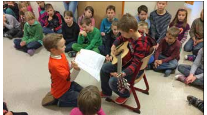
Im Dezember öffnete sich der „lebendige Adventskalender“ in der Grundschule Teichwolframsdorf mit Beiträgen der Kinder.