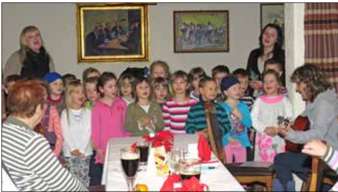
KITA-Kinder erfreuen die Senioren der Volkssolidarität mit einem Weihnachtsprogramm im Gasthaus „Zum kühlen Morgen“