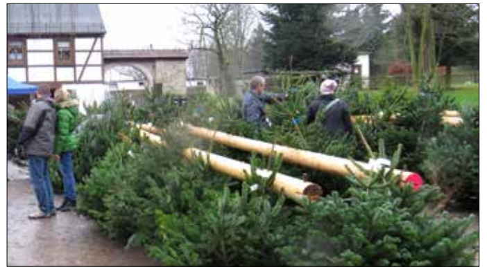
Auch wenn das Wetter nicht so gut war zog es viele zum Weihnachtsbaumverkauf nach Waldhaus. Neben den vielen vorbereiteten Weihnachtsbäumen konnte man sich auch seinen Baum frisch fällen lassen.