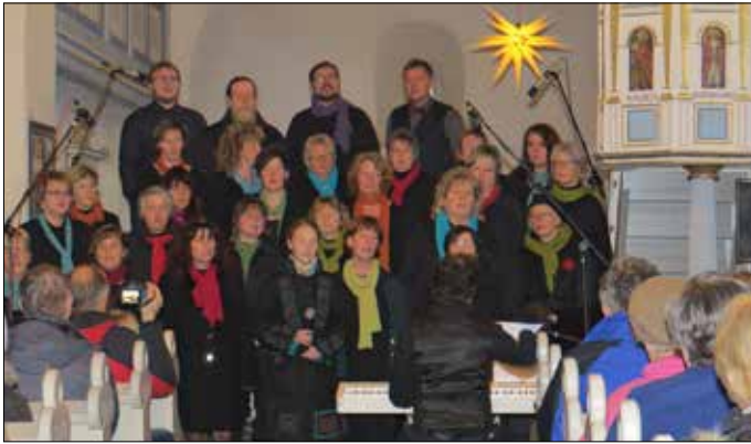
Weihnachtsmarkt in Waltersdorf – Menschenmassen wälzten sich durch das festliche Gelände. Ob bei der Aufführung, beim Gospelchorkonzert in der Kirche oder im Gewölbe, überall gab es Höhepunkte. Es ist der größte Weihnachtsmarkt in unserer Gemeinde. Einen großen Dank all den Organisatoren.