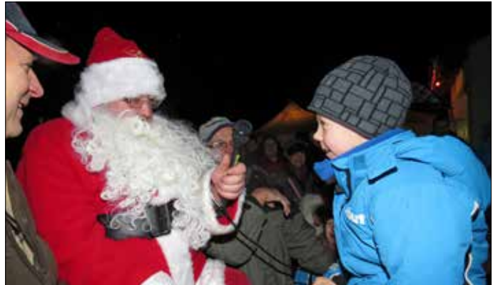
Weihnachtsmarkt in Gottesgrün - Einen Schneeberg für die Kleinen, einen Gottesdienst, eine feine Ausstellung alter Werkzeuge und Hausgeräte und natürlich der Weihnachtsmann sorgten für eine festliche Stimmung rund um das Gemeinschaftshaus der Feuerwehr.