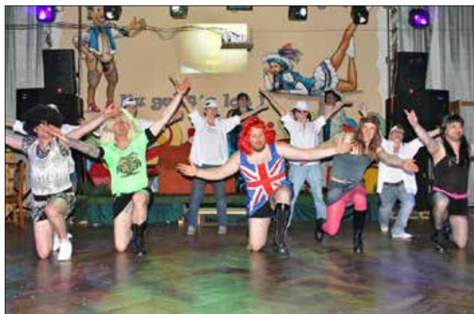
Das Männerbalett begeisterte zur Galaveranstaltung des TCC '84 das Publikum.