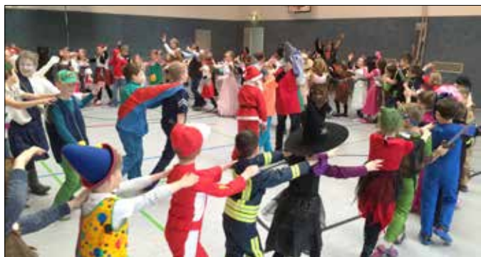
Die Schüler der Grundschule Teichwolframsdorf

Am 17.02. war das Schulhaus voller Clowns, Prinzessinnen und anderer wunderlicher Gestalten. Fasching war angesagt, mit lustigen Spielen, Tänzern und viel Spaß in der Turnhalle. Wir bedanken uns auch beim TCC für den tollen Auftritt und die Süßigkeiten.