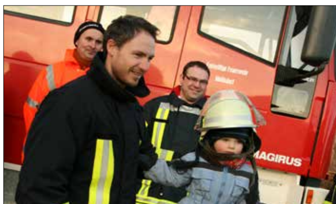
Unterstützung bei präventiven Hochwasserschutzmaßnahmen durch die Diakonie Katastrophenhilfe – Das Sachgebiet Brand- und Katastrophenschutz beim Landratsamt Greiz vermittelte der Gemeinde im Mai 2014 den Kontakt zur Diakonie Katastrophenhilfe. Diese hatte die präventive Unterstützung der Freiwilligen Feuerwehren in hochwassergefährdeten Gebieten angeboten. Über den Ortsbrandmeister und die Verwaltung wurde der mögliche Bedarf in Form von Ausrüstungsgegenständen, wie z.B. Schmutzwasserpumpen, Schlauchmaterial, Generatoren, Rettungsboote mit Anhängern zur Evakuierung und Versorgung von Personen, mobile Hochwassersysteme etc. für die Freiwillige Feuerwehr der Gemeinde Mohlsdorf-Teichwolframsdorf ermittelt. Die Liste der angemeldeten Ausrüstungsgegenstände für die Gemeinde war lang. Bei einzelnen Ausrüstungsgegenständen, wie im Bereich der mobilen Hochwasserschutzsysteme, erhielt die Gemeinde die Mitteilung, dass aufgrund der unerwartet hohen Anzahl an Fragen mit großen Stückzahlen und unterschiedlichen Bauweisen eine ausschließliche Förderung über die Diakonie Katastrophenhilfe nicht realisierbar sei. Für andere Ausrüstungsgegenstände, wie z.B. Tauchpumpen, Notstromaggregate, Wathosen, Rettungswesten etc. erhielt die Gemeindeverwaltung die Information, diese im Februar 2015 von der Diakonie Katastrophenhilfe, Fluthilfbüro, in Empfang zu nehmen. Die Bürgermeisterin sprach in ihrem und im Namen der Feuerwehrkameraden ihren Dank dem Fluthilfbüro und Spendenbeirat der Diakonie Katastrophenhilfe für die großzügige Unterstützung aus. Dennoch hegt sie die Hoffnung, dass wenig Gebrauch von den Ausrüstungsgegenständen gemacht werden muss und die Gemeinde und die Region von Katastrophen, wie dem Hochwasser Mai 2013, zukünftig verschont bleibt.