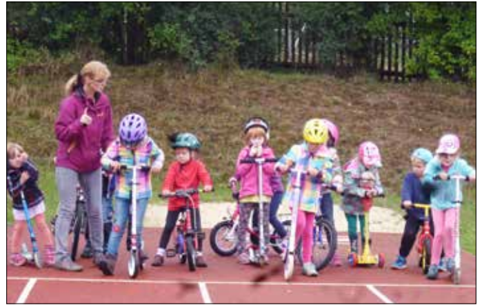
Auf die Plätze-fertig – los: Beim Rollerfest ging es nicht nur um Schnelligkeit. Danke, dass wir den Sportplatz der Schule mit nutzen durften. Da fuhr es sich am besten!!!