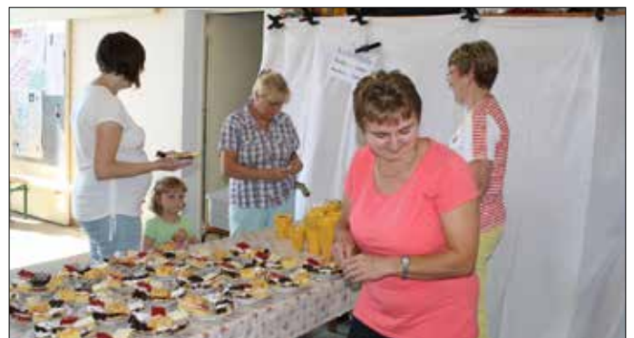
Impressionen vom Feuerwehrfest und dem Bobbycar-Rennen