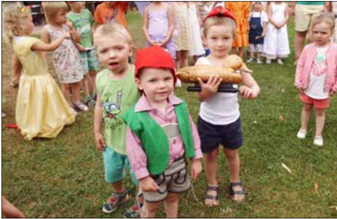
Wer ist wer beim Märchenfest? Ein schöner Höhepunkt in der Ferienzeit.