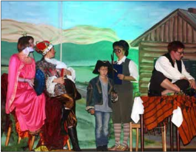
Auch in diesem Jahr sorgte die Theatergruppe der Kita „Regenbogen“ mit ihrer Inszenierung von „Das tapfere Schneiderlein“ für einen vollen Saal im Gasthaus „Zum kühlen Morgen“. Dank des Engagements und der vielen vorangegangenen Proben der Laiendarsteller wurde auch dieses Theaterstück wieder ein voller Erfolg.