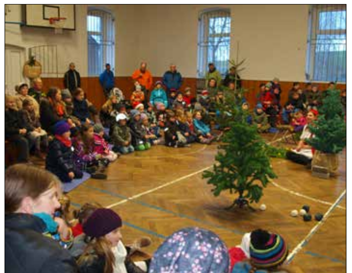
Aufmerksam verfolgten die Kinder die Märchenaufführung in der Sporthalle.