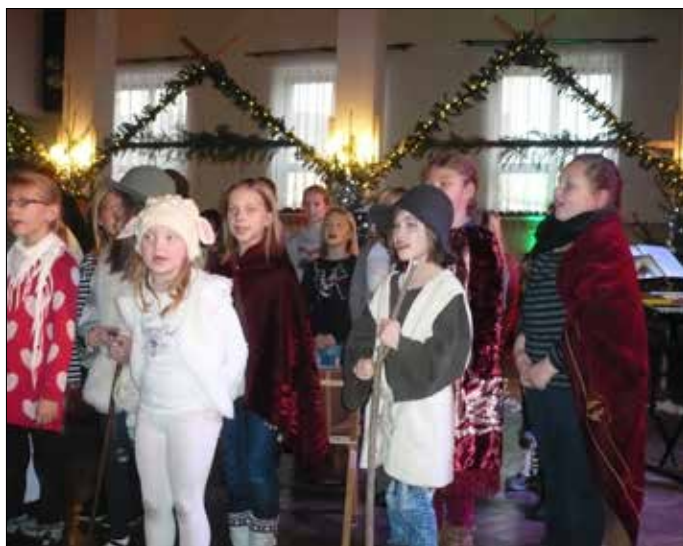
Beim Weihnachtsmarkt in Teichwolframsdorf zeigten die Kinder Grundschule Teichwolframsdorf ein Krippenspiel. Auch in Waltersdorf fand die Aufführung großen Anklang beim Publikum.