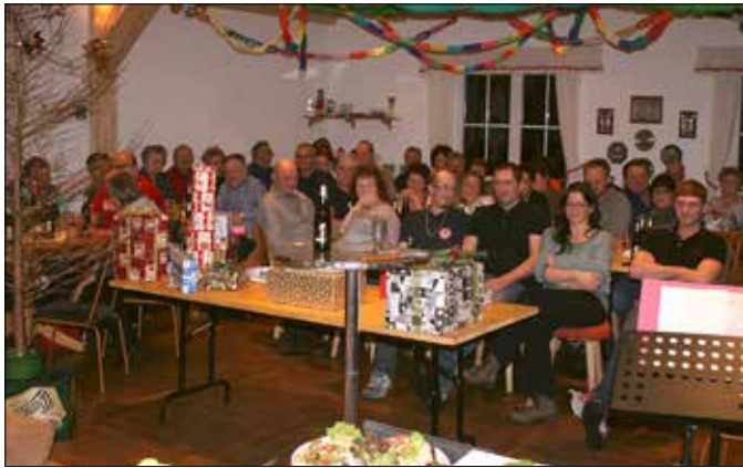
Reges Interesse fand die Versteigerung der Tannenbäume in Gottesgrün

Bandke waren dieses Jahr für den komödiantischen Teil zuständig, die Lachmuskeln wurden arg strapaziert.