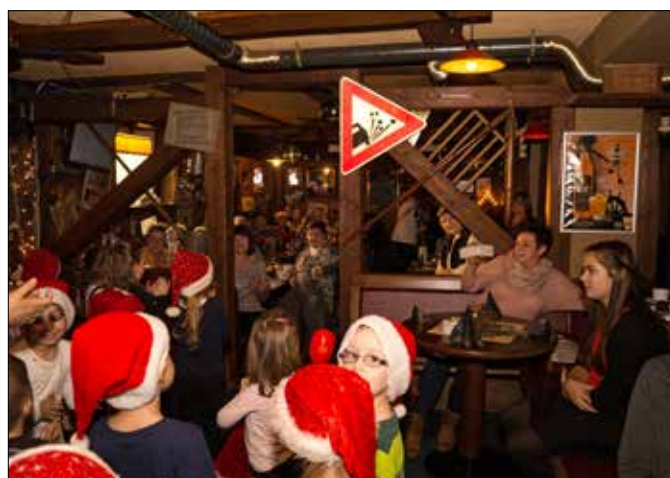
Die Organisatoren des Rentnertreffs