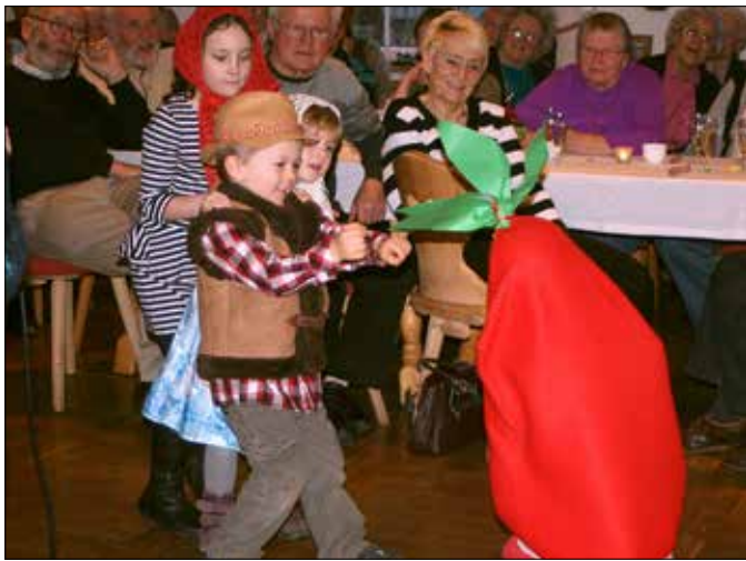
Die Kinder führten „Großvaters Rübenerte“ auf