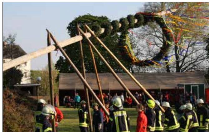
FFw und Feuerwehr-Verein e.V. Kleinreinsdorf

Am 30.04.2017 wurde wie jedes Jahr der Maibaum aufgestellt. Dabei unterstützten Mitglieder des Sportvereins die Kameraden der Freiwilligen Feuerwehr. Aufgrund des stürmischen Windes kostete es diesmal besonders viel Kraft und Geschick, den Baum ohne Pannen aufzustellen. Der Wind war dann auch für den Hexenfeuer eine Gefahr. Deshalb hat die Feuerwehr entschieden, einen kleineren Haufen anzuzünden, damit das Feuer unter Kontrolle bleibt. Sportverein und Feuerwehrverein sorgten für das leibliche Wohl der Gäste und die Schalmeeikapelle für Unterhaltung. Allen Beteiligten ein herzliches Dankeschön für ihre Arbeit.