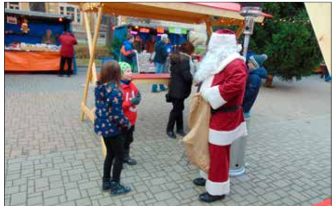
Freiwillige Feuerwehr Teichwolframsdorf e.V.

Wir möchten uns nachträglich bei allen Helfern der Feuerwehr, den freiwilligen Helfern in der Kaffeeküche, den Hortkindern unserer Grundschule, den 3 Jugendlichen für ihre Zither-Vorführung, dem TCC, der Bastelstube, dem Modelleisenbahnverein Seelingstädt, den Klöppelfrauen aus Teichdorf und letztlich bei allen Händlern und Besuchern für einen gelungenen Weihnachtsmarkt 2017 recht herzlich bedanken.