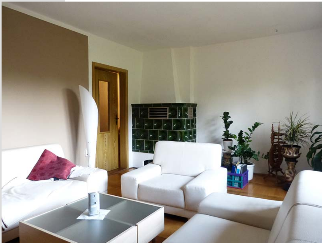
Wohnzimmer mit zusätzlicher Heizmöglichkeit