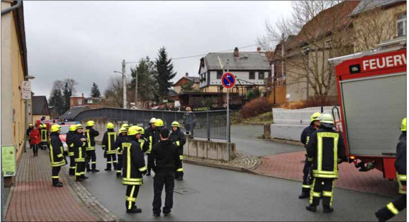
Großeinsatz der Feuerwehren von Greiz, Gommla, Kurtschau und Mohlsdorf, der PI Greiz und Energieversorgung. Es gab einen Gasgeruch in der Albert-Steinbach-Straße in Reudnitz. Mit den Messgeräten konnte er aber nicht eindeutig nachgewiesen werden, so die Aussage von Zeugen.