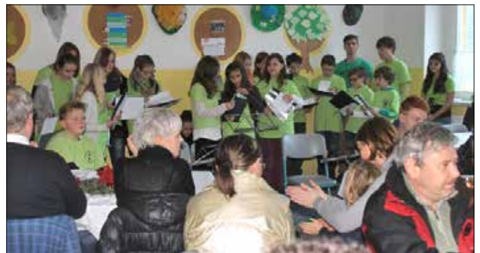
und „Der Schulchor gestaltete zum Weihnachtsmarkt ein kleines Programm.“