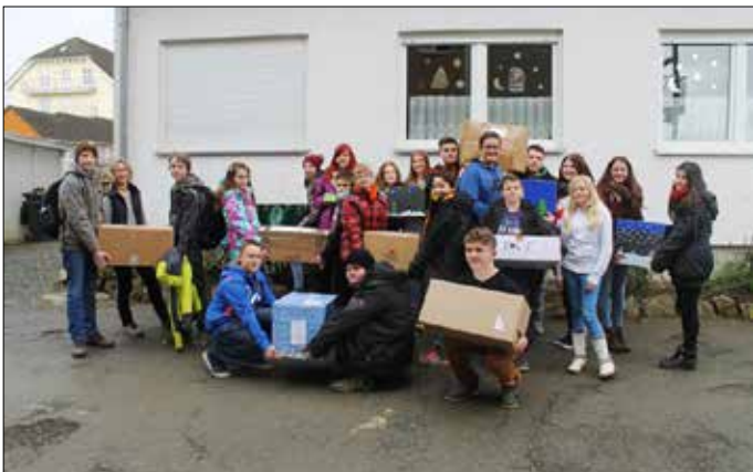
Spendenaktion der Freien RS Reudnitz für die Kinder von Brest