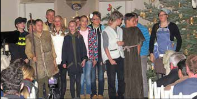
Krippenspiel am Heiligen Abend in der vollbesetzten Herrmannsgrüner Kirche in Mohlsdorf