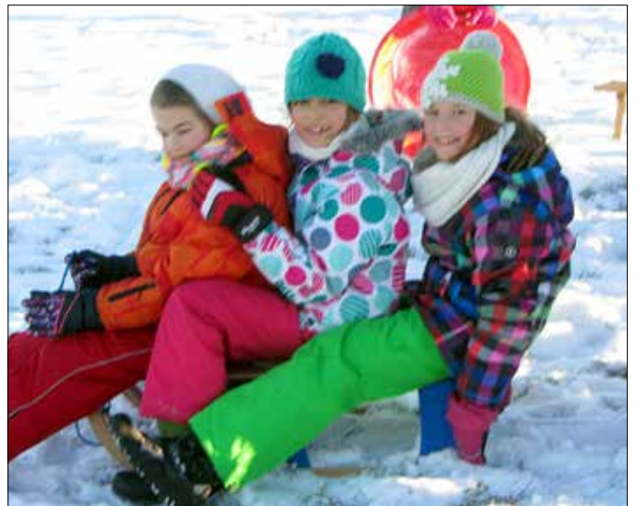
Endlich Winterwetter! Das nutzten unsere Lehrerinnen und Kinder der Grundschule Teichwolframsdorf spontan für einen Winter-Rodel-Wandertag. Und man sieht's ihnen an – es hat Spaß gemacht.