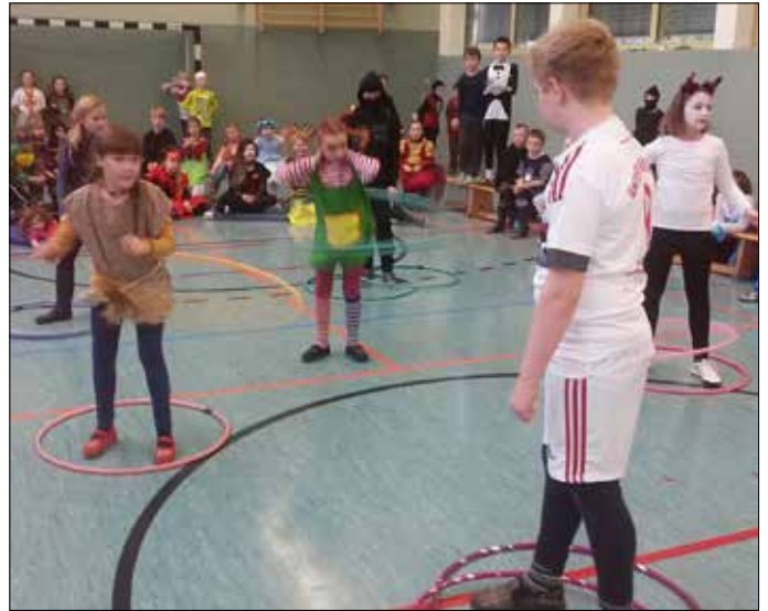
Ein toller Fasching in der Grundschule Mohlsdorf, der neben Spiel und Spaß, Polonäse und Hula-Hopp auch Sport und Wissensfragen im Programm hatte. Die Kinder waren mit viel Freude und Begeisterung dabei.