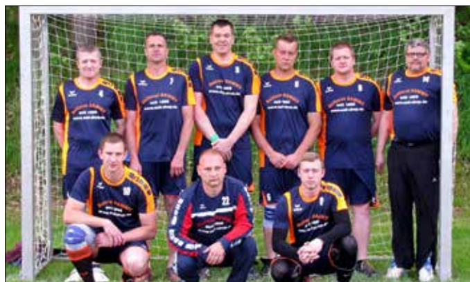
Der Turniervoransteller 2017

Ihnen allen danken wir für Ihre hilfreiche Unterstützung. Am Abend sorgt der DJ für Stimmung beim Tanz.