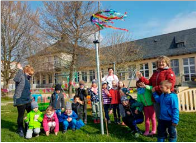
Die Kinder und das Team der Kita „Regenbogen“