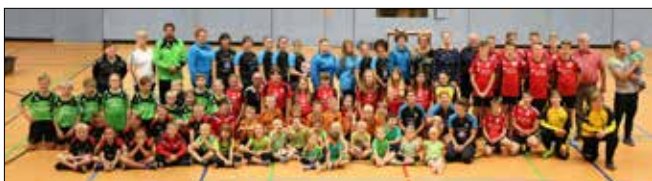
Die TSG Concordia im Jahr 2019

– Die Concordia Reudnitz wird die Trainingseinheiten mit ihren zurzeit rund 100 Aktiven im Kinder- und Jugendbereich in der Sommerzeit auch auf dem Sportplatz durchführen.