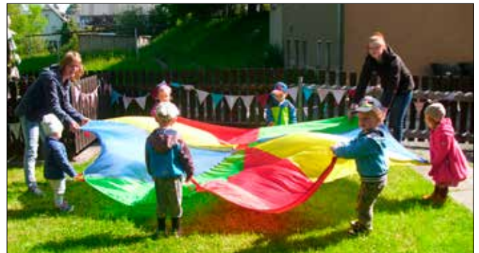
Team der Kita „Gänseblümchen“

Treffsicherheit gefragt beim Jonglieren und Zielweitwurf. Fleißig wurde geübt, wer die meisten Punkte erzielte. Als Überraschung gab es für alle Kinder ein kleines Geschenk, was sie mit nach Hause nehmen durften. Zum Abschluss stiegen gleich 2 „Kleine Onkels“ von Pippi Langstrumpf als Steckenpferd aus dem Karton, die auch gleich mit den Kindern durch den Garten galoppierten. Die Pferdchen wurden in den Stall gebracht und so war der schöne Vormittag leider viel zu schnell zu Ende.