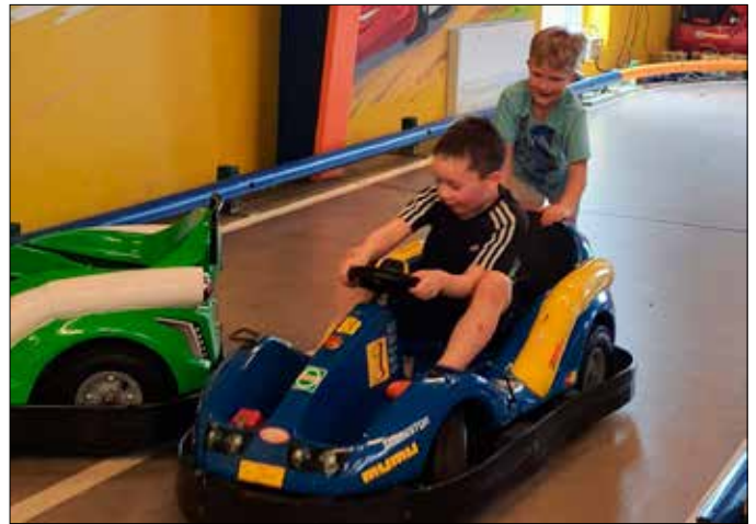
Der Hort der Grundschule Mohlsdorf