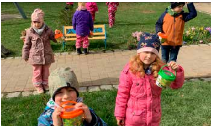
Die Kinder und Erzieher der Kita „Sonnenschein“ Teichwolframsdorf

Unser diesjähriges Osterfest fand am 5. April statt. Wir läuteten diesen besonderen Tag mit einem musikalischen Morgenkreis ein, an dem alle Kinder der Kita teilnahmen. Anschließend ging es mit einem ausgewogenen Osterbuffet im Turnraum weiter. Gegen 10 Uhr machte sich die gesamte Kita auf die Suche nach dem Osterhasen. Nach kurzer Zeit fanden die Kinder die erste Spur: einen Brief vom Osterhase! Er schrieb, dass er uns beobachtet und wir kleine Aufgaben lösen sollen, um auf der richtigen Spur zu bleiben. Nach zwei weiteren Briefen und Aufgaben, führt uns der Weg zurück zur Kita. Dort sahen wir den Osterhase noch schnell hinterm Haus verschwinden und uns war klar: HIER SIND WIR RICHTIG! Es dauerte nicht lange und jedes Kind fand ein kleines Osternest, bestehend aus einer Becherlupe und etwas Süßem. Nach diesem tollen Tag strahlten alle Kinderaugen. Ein sehr großer Dank gilt auch dem Osterhasen, der den Kindern und Erziehern einen nagelneuen Grill mit Zubehör gebracht hat.